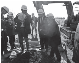
改良土を触って確認