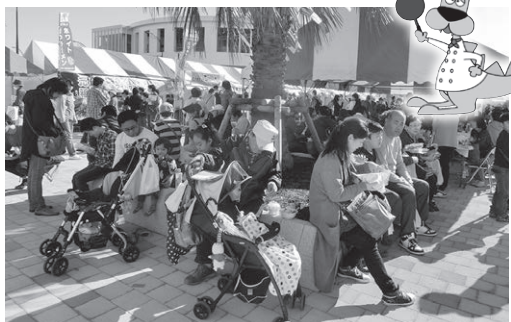
そでがうらマルシェ2015の様子

昨年好評だったそでがうらマルシェ2015に引き続き、平成28年度も開催予定。国の地方創生加速化交付金（補助率10割）を活用するため、平成27年度補正予算に計上。昨年はイタリアンなど洋食のレシピを開発して、イベントを行いました。今年は和食のレシピを開発するとのことです。