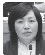
肋波 久子 議員 (日本共産党袖ヶ浦市議員)

・袖ヶ浦駅北口のまちづくりについて ・浜宿団地に隣接した残土埋め立 て計画について ・子育ての切れ目のない支援につ いて