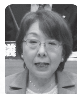
前田 美智江 議員 (公明党)