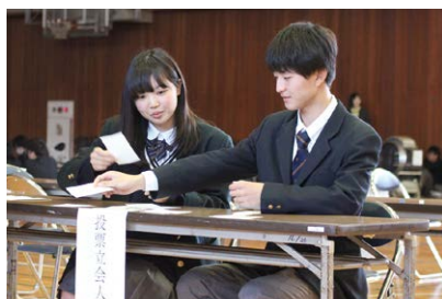
受付・用紙交付・立会人も生徒が行いました

説明後、新3年生のうち、7月の参議院議員選挙時に選挙権を有する77名が模擬投票を行いました。本市では10月16日に市議会議員選挙が予定されています。選挙権年齢が引き下げられてから県内初の市議会議員一般選挙となります。