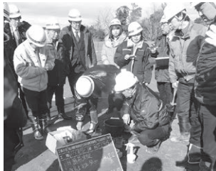
海側所管事務調査