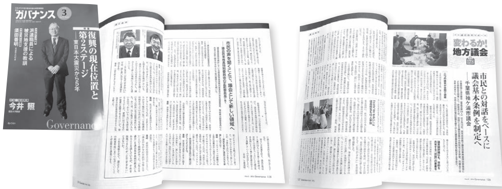
袖ヶ浦市議会の取組みが「月刊ガバナンス」に掲載されました