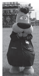
ガウラ in気志團万博